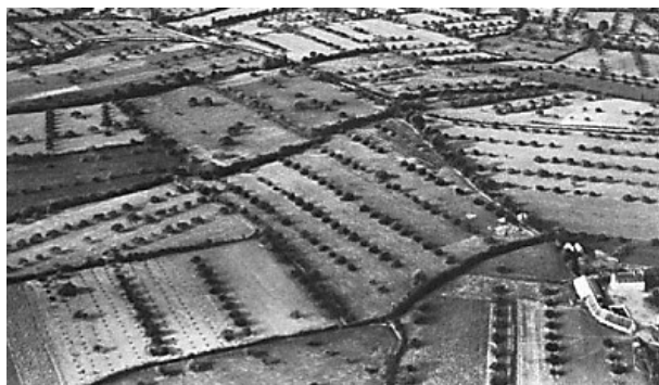
Le bocage agroforestier dans le Perche de l'Eure-et-Loir, près de Nogent-le-Rotrou en 1950

Association d'Agroforesterie de la région Centre-Val de Loire Courriel : contact@a2rc.fr / www.a2rc.fr