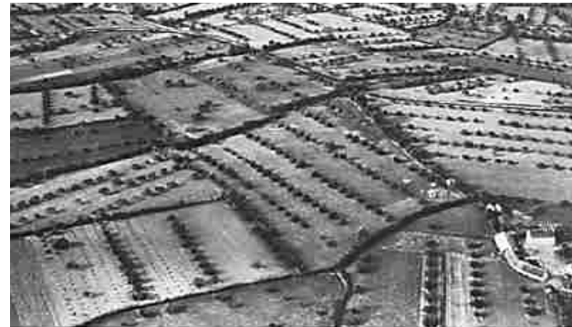
Le bocage agroforestier dans le Perche de l'Eure-et-Loir, près de Nogent-le-Rotrou en 1950

A2RC INRAE – Frédérique Santi 2163 Avenue de la Pomme de Pin – CS 40001 Ardon 45075 ORLEANS Cedex 2